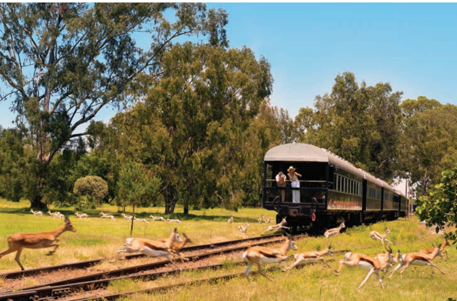
ROVOS RAIL, TREN DE LUJO

EXPLORA EL ÁFRICA MERIDIONAL EN UN TREN DE LUJO, EL ROVOS RAIL