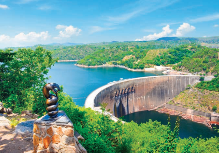
PRESA DEL LAGO KARIBA