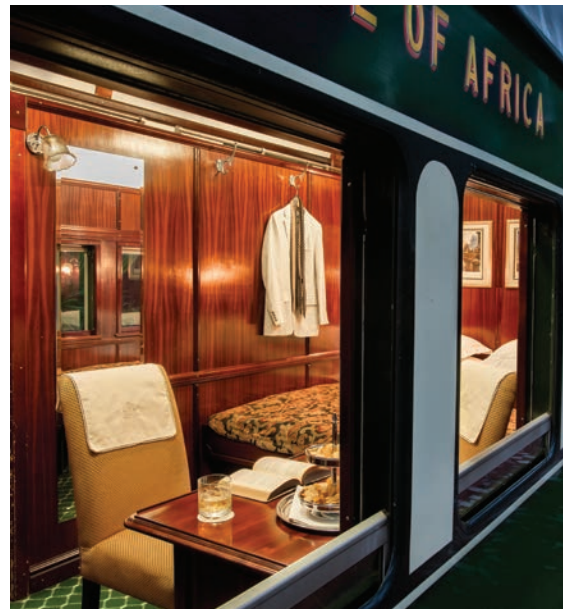
SUITE DE LUJO