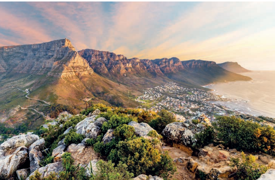
MONTAÑA DE LA MESA