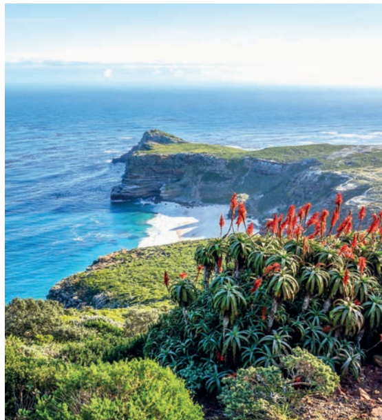
EL CABO DE BUENA ESPERANZA